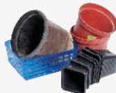
Pots et barquettes de jardinage