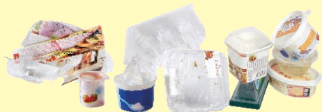
Boîtes, pots et barquettes