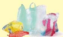
Sacs et suremballages